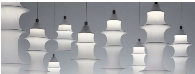
FALKLAND BRUNO MUNARI 1964 FALKLAND 53 - 85