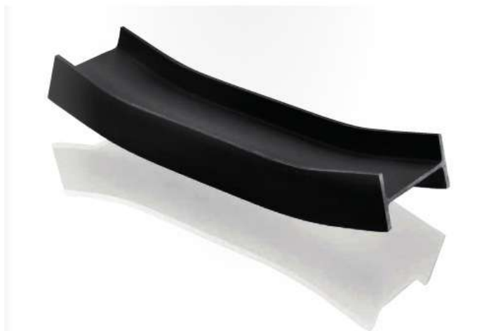
PUTRELLA ENZO MARI 1958

"Una putrella che con due gesti diventa un vassoio. E già ci siamo dimenticati cosa era prima. Il nostro cervello tende a registrare in primo luogo quei segni minimi che in un rapporto di proporzionalità inversa caratterizzano maggiormente una cosa. il passaggio tra due mondi diametralmente opposti in due semplici e lievi piegature."